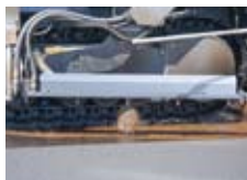
喷洒技术 喷洒技术使粘层油喷洒均 匀，乳化沥青油膜完全覆 盖现有路面，不存在漏洒 区域。