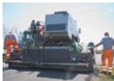
液压伸缩式熨平板 该款喷洒型摊铺机，能够配 备AB 500-2或AB 600-2液 压伸缩式熨平板