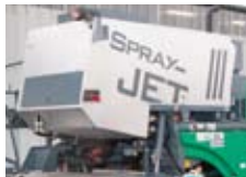
标准型乳化沥青罐 标准的隔热型乳化沥青罐， 容量为2,000 l。