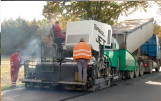
装备喷洒模块的超级1800-2摊铺机，能够更加高效、经济、清洁的完成摊铺施工。