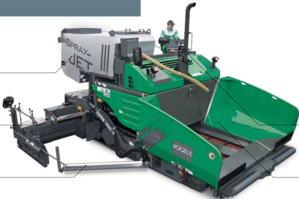
操纵理念 喷洒模块易于操纵，为自解 释性标识。